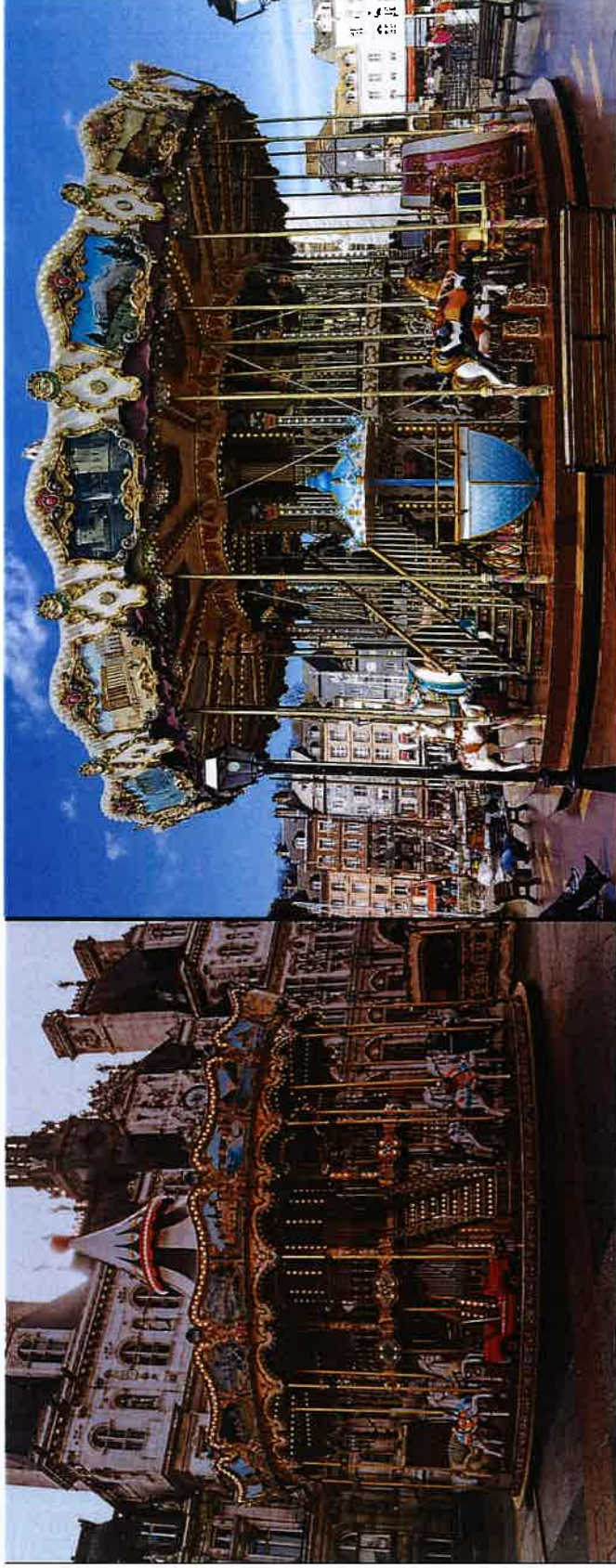
Prijedlozi za lokaciju Trg 111. brigade Hrvatske vojske